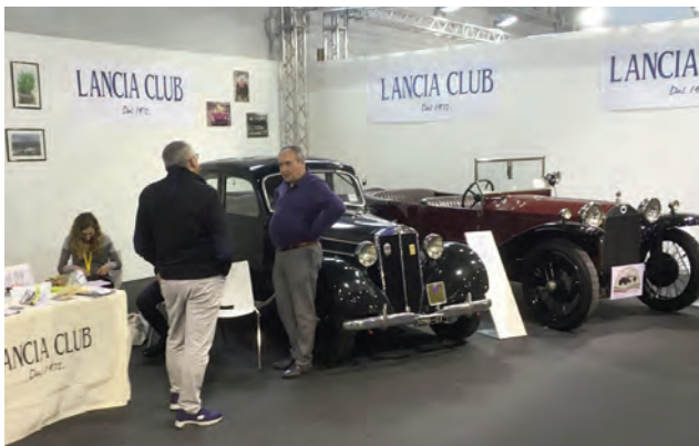
Italienska Lancia Clubs monter

Vi stötte på en fantastisk fin Stratos. Det var en av de 13 JOLLY Stratosarna, dessa byggdes ihop av originaldelar efter det att Lanciafabriken upphört bygga dessa bilar.