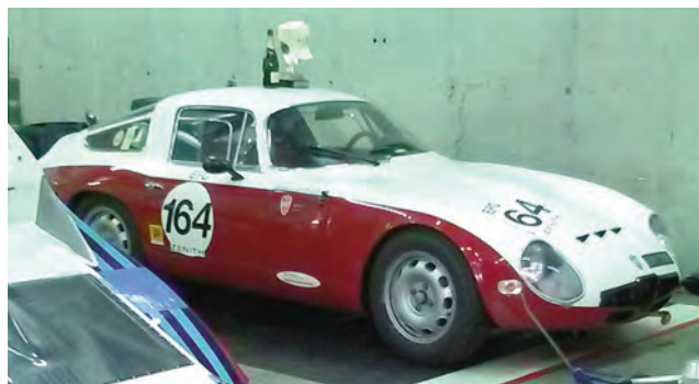
Alfa Romeo Tubolare Zagato 1