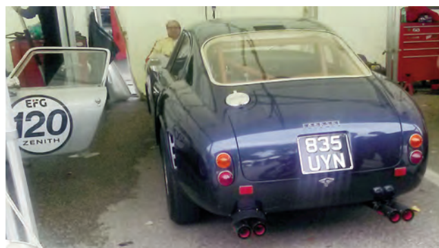
Ferrari 250 SWB från femtiotalet.

Mer info och massor av bilder hittar du på denna länk till Sports Car Digest: https://www.sportscardigest.com/imola-classic-2018